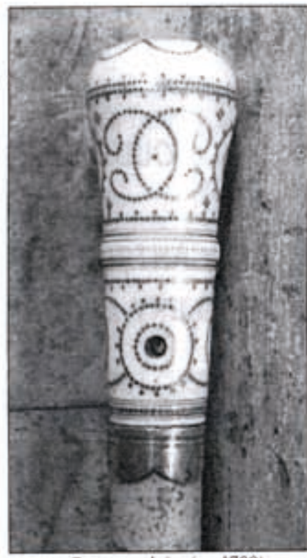
Canne anglaise (ca 1700)

ouvert du mardi au samedi de 10h à 18h dimanche de 10h à 14h