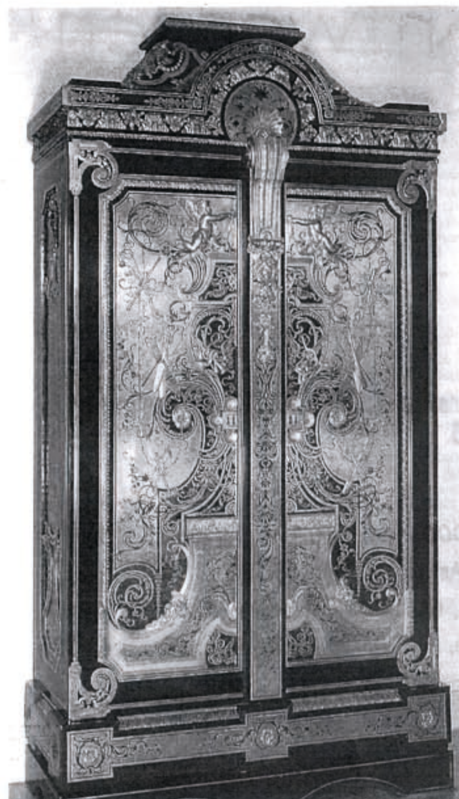
Kast van André-Charles Boulle, de deuren zijn in "partie", er bestaat een tweede kast waarvan de deuren in "contre-partie" zijn. Dit meubel draagt de stempel van J.-H. Riesener omdat deze meubelmaker de kast restaureerde eind 18e eeuw. Collectie Musée du Louvre

Regelmatige import van mooie en eerlijke 18e en 19e eeuwse Engelse meubelen en decoratieve elementen. Speciaal voor handelaren en decorateurs.